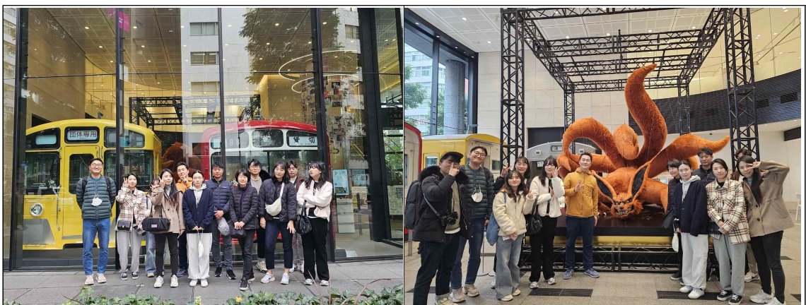
애니메이션 도쿄역 방문사진