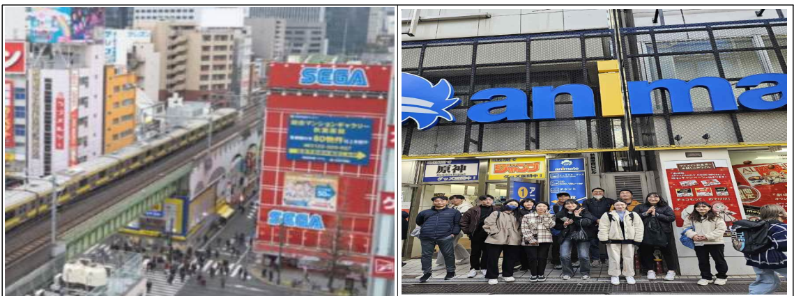
아키하바라 거리 및 방문 사진