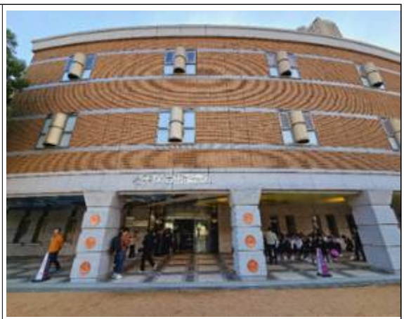
데즈카오사무 박물관 외관 및 방문 사진