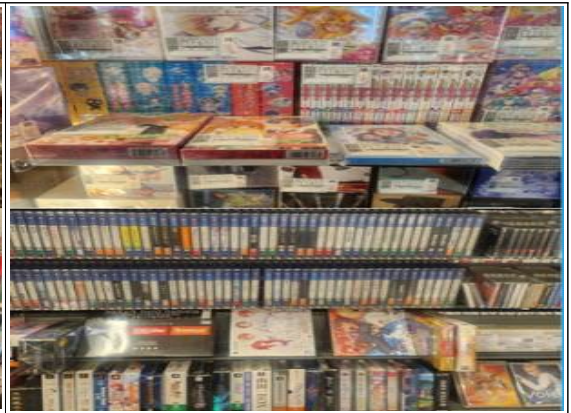
CD 및 DVD