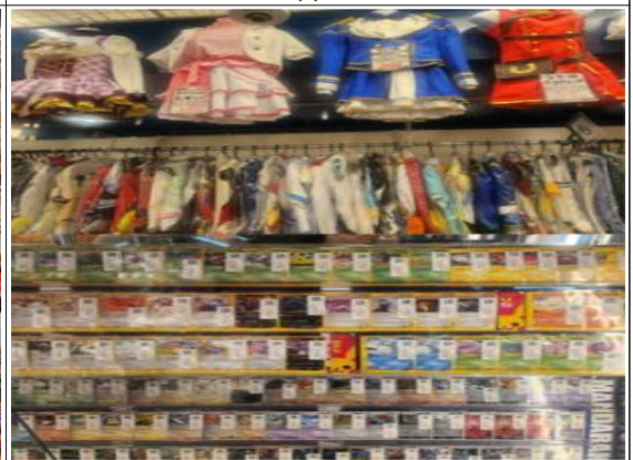
코스프레 용품, 각종 카드