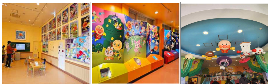
전시 및 체험공간