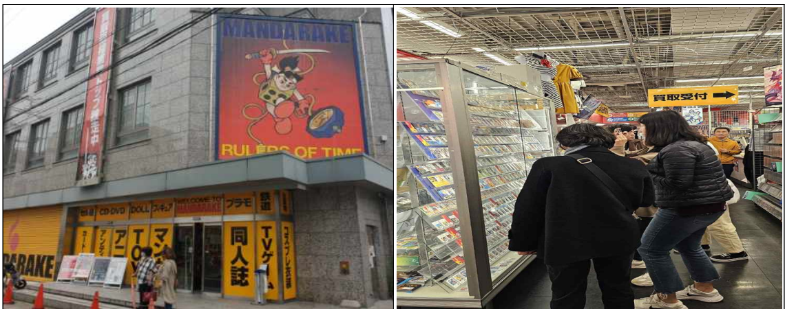
만다라케 나고야점 외관 및 방문 사진