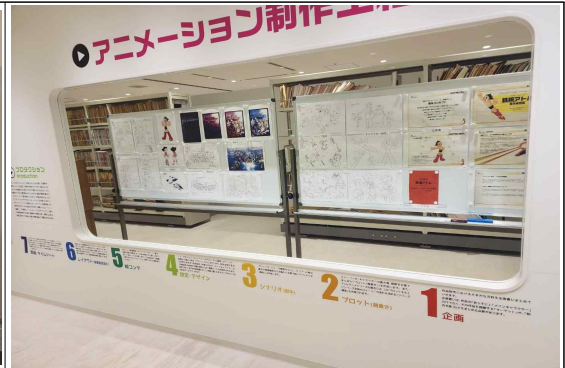
애니메이션 제작과정 소개