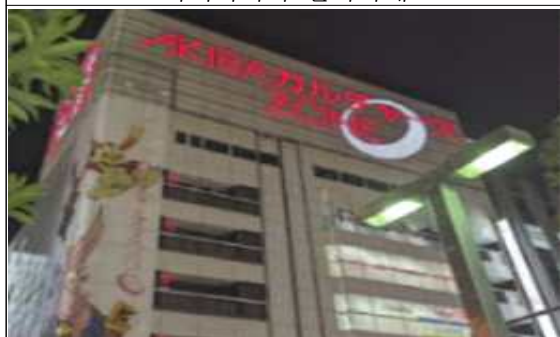
AKIBA 컬처즈 ZONE