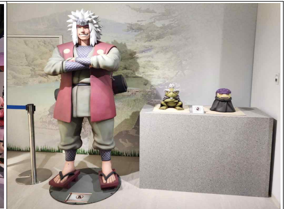
실물 크기의 나루토 캐릭터 피규어