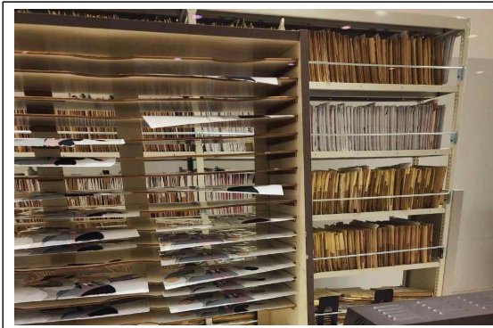
애니메이션 대본 등