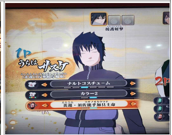
나루토 캐릭터를 커스터마이징 해서 진행할 수 있는 콘솔 게임