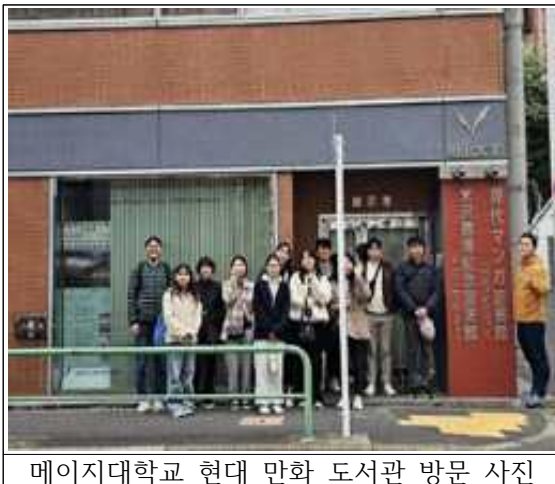
메이지대학교 현대 만화 도서관 방문 사진