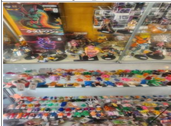
피규어 및 인형