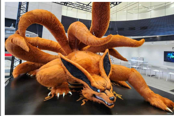
(특별 전시) 나루토 등장 캐릭터인 대형 구미 조형물 설치