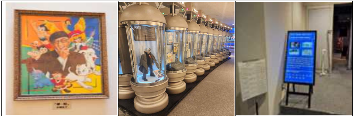
1층: 데즈카오사무의 생애를 전시한 상설 전시 및 애니메이션 상영관(아툼 비전)