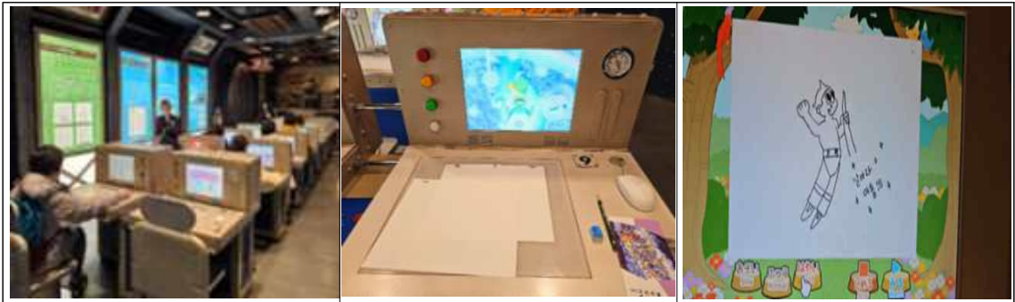
G층: 직접 움직이는 애니메이션을 만들어 볼 수 있는 체험시설