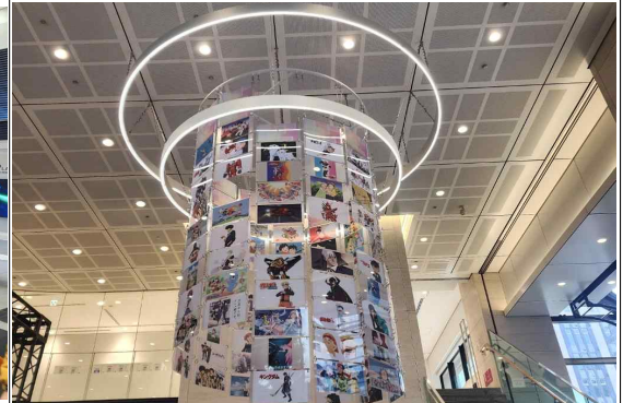
인기 애니메이션 그림