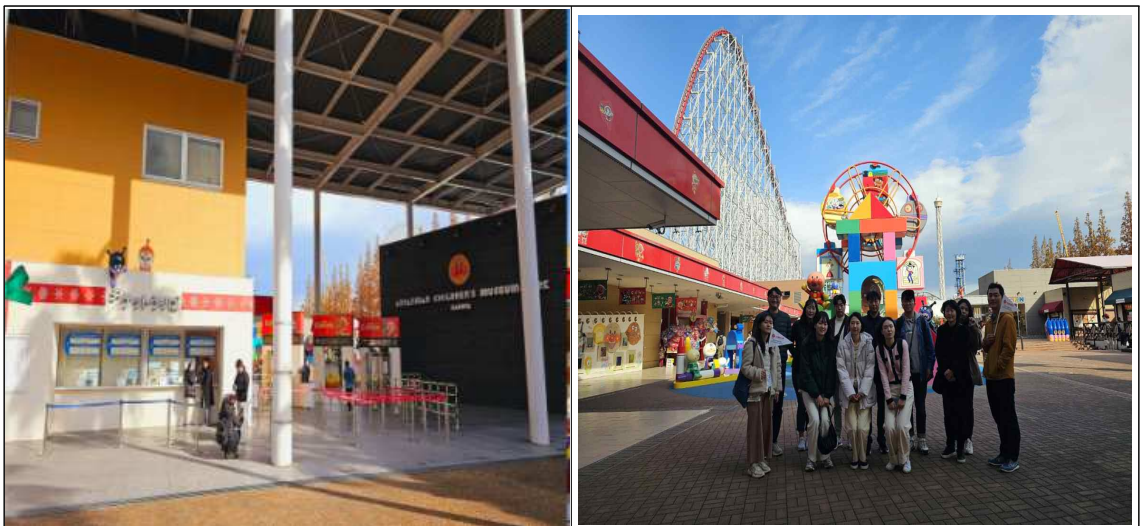
나고야 호빵맨 박물관 외관 및 방문 사진